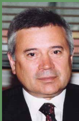
АЛЕКПЕРОВ ВАГИТ ЮСУФОВИЧ Президент ОАО «ЛУКОЙЛ»

ОАО «ЛУКОЙЛ» – одна из крупнейших международных энергетических компаний. Основные виды деятельности – разведка и разработка месторождений нефти и газа, производство и реализация нефтепродуктов, нефтехимической продукции и электроэнергии. На предприятиях Группы «ЛУКОЙЛ» трудится около 150 тыс. человек. Компания работает в 60 регионах России и более чем 40 зарубежных странах. В структуру компании входят 9 нефтеперерабатывающих заводов. Сбытовая сеть ЛУКОЙЛа превышает 6,7 тыс АЗС и охватывает 46 регионов РФ, 25 стран Европы, Балтии и СНГ, а также 13 штатов США.